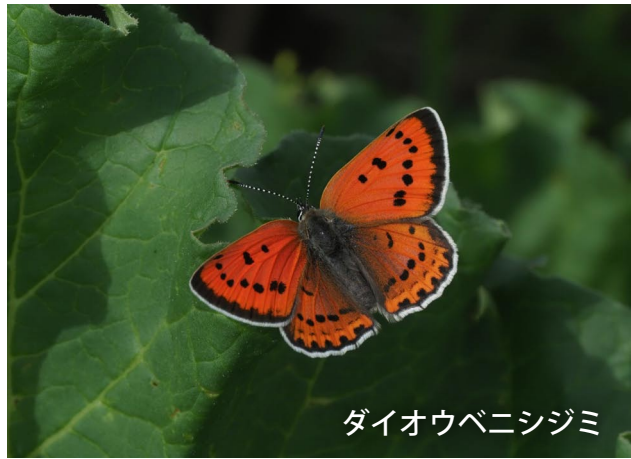
ダイオウベニシジミ